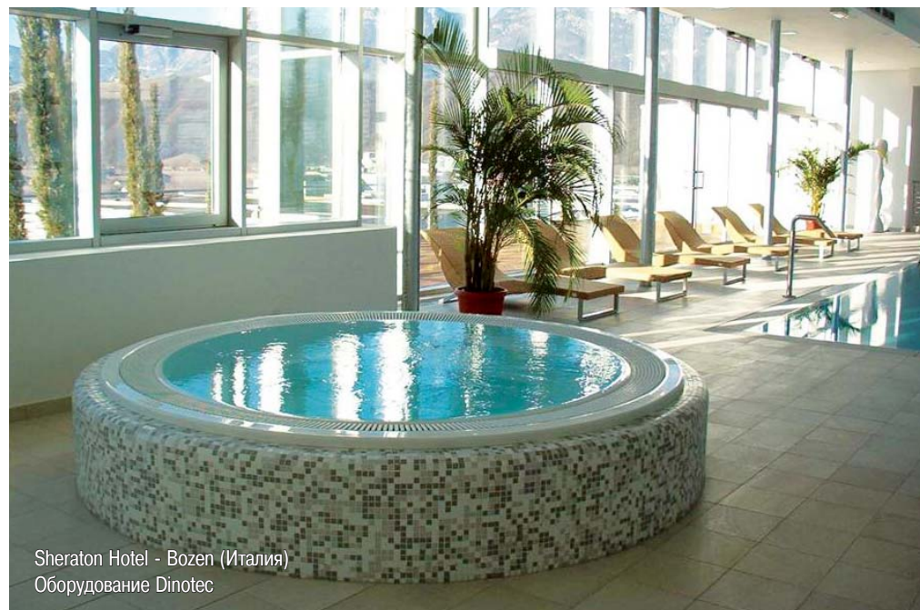
Sheraton Hotel - Bozen (Италия) Оборудование Dinotec

другим корпорациям. Более 10% всех сотрудников Dinotec заняты в области технологических разработок и инноваций – это бесценный потенциал в области знаний и идей. Поэтому и в будущем наши клиенты могут рассчитывать на замечательные разработки в