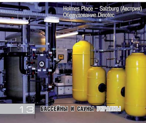
Holmes Place – Salzburg (Австрия) Оборудование Dinotec

В октябре на выставке Aquanale-2011 в Кёльне посетители и специалисты с боль-