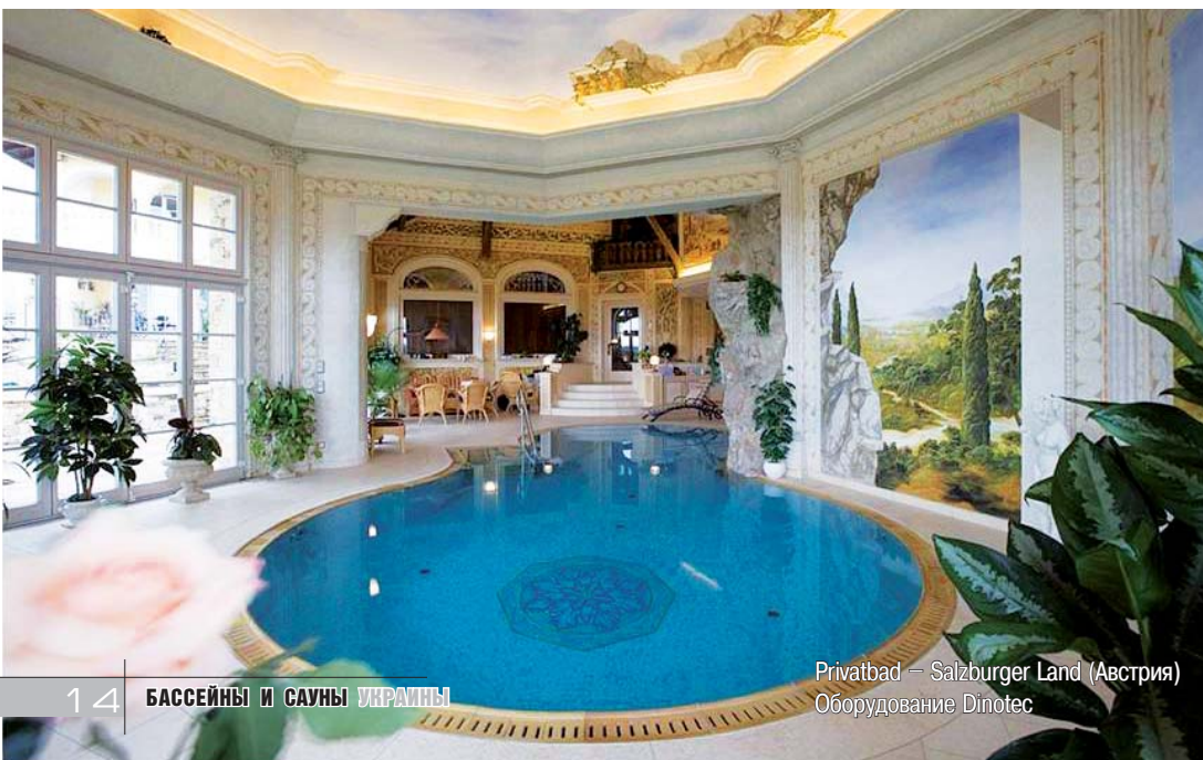
Privatbad – Salzburger Land (Австрия) Оборудование Dinotec