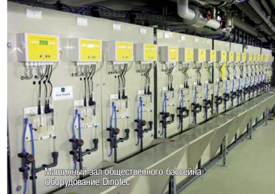
Машинный зал общественного бассейна Оборудование Dinotec

Решающим для заказчика становится хорошее качество воды, комфорт в общении с производителем и надежность системы. В итоге, цена на обо-