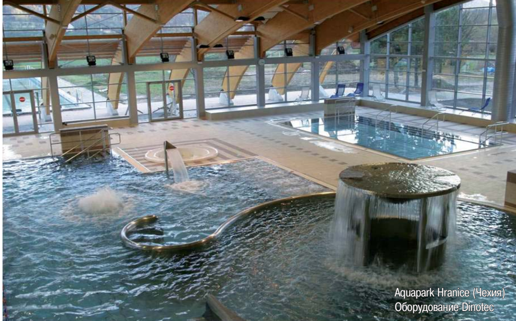
Аквапарк Hranice (Чехия) Оборудование Dinotec

области управления бассейнами и спа, измерительно-регулирующей и дозирующей техники, наших комплексных систем водоподготовки.