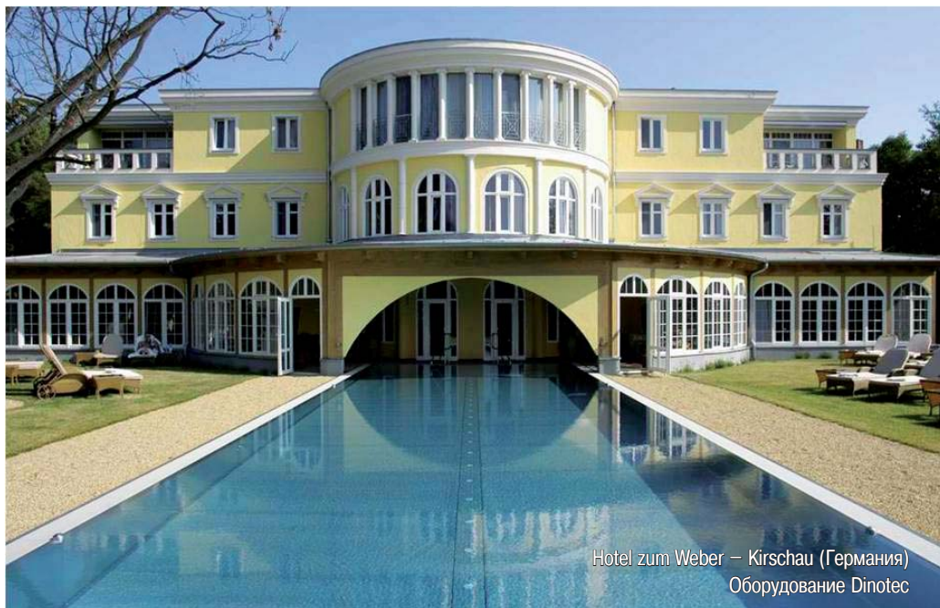
Hotel zum Weber – Kirschau (Германия) Оборудование Dinotec

Серии наших приборов dinotecNET+ , Poolcontrol DYNAMICS и Water Guard также разработаны для использования как в частных, так и в общественных бассейнах, гостиницах и спа-центрах. Эта «умная» техника показывает отличные результаты и – что довольно